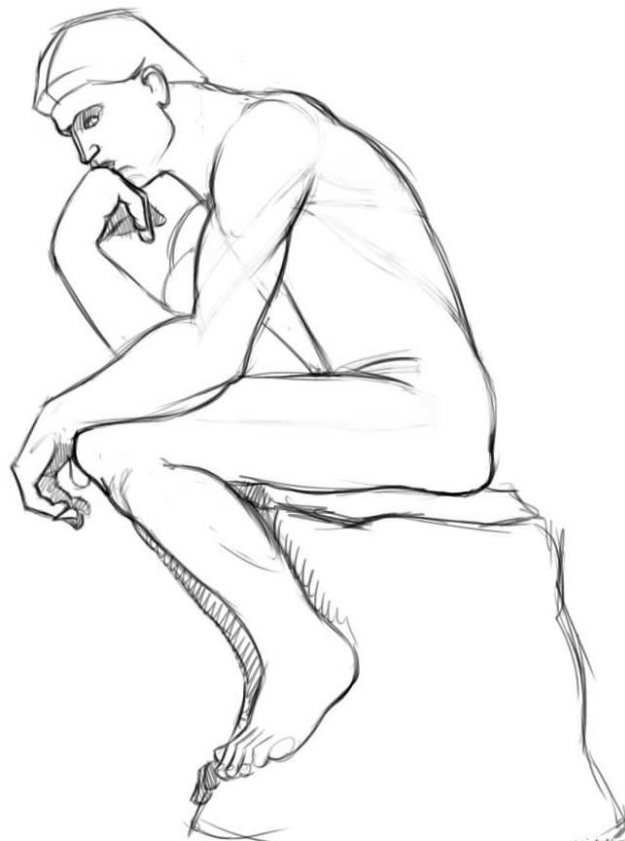
The Thinker Statue by Auguste Rodin